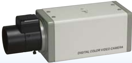
ワイドダイナミックカメラ SCB-6100WD