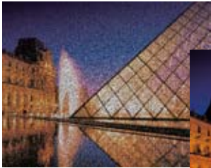
3D DNR OFF