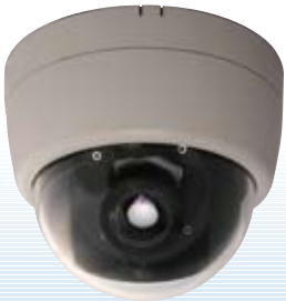
ワイドダイナミックカメラ