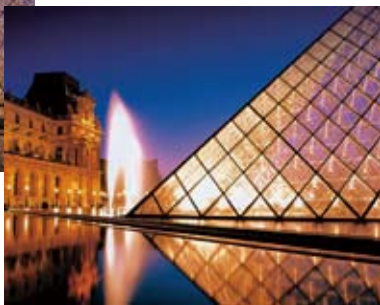
3D DNR ON